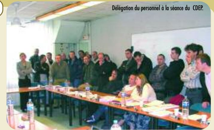
Délégation du personnel à la séance du CDEP.

Ils alertent les directeurs sur les conditions de réalisation de